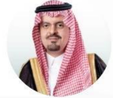
نائب أمير منطقة مكة المكرمة صاحب السمو الملكي الأمير سعود بن مشعل بن عبدالعزيز آل سعود