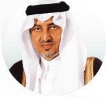
أمير منطقة مكة المكرمة صاحب السمو الملكي الأمير خالد الفيصل بن عبد العزيز آل سعود